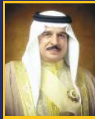
His Majesty King Hamad bin Isa Al Khalifa King of the Kingdom of Bahrain