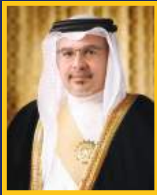
His Royal Highness Prince Salman bin Hamad Al Khalifa Crown Prince and Prime Minister